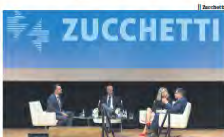
En imagen los directores generales de IDS, i68 y Zucchetti Spain.

Así lo remarcaron en el acto de presentación oficial, celebrado en el Palacio Euskalduna ante