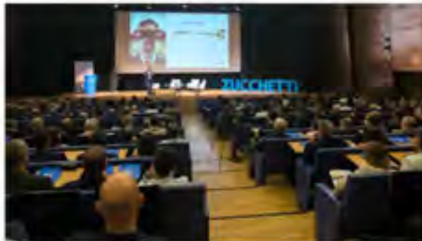
La presentación tuvo en el Palacio Euzkalduna de Bilbao a la que asistieron más de 400 clientes, proveedores, partners y colaboradores.

En la presentación se abordó en los momentos de intervención que han posicionado a Zucchetti Spain como el referente de los fabricantes de software en nuestro país, el gran catálogo de soluciones, la apuesta clara por el HD-compatibility y los departamentos propios en nuestro país, la garantía del servicio técnico. Una distribución más directa con el cliente a través de canal y el esfuerzo de la integración que ofrece la pertenencia al Grupo Zucchetti.