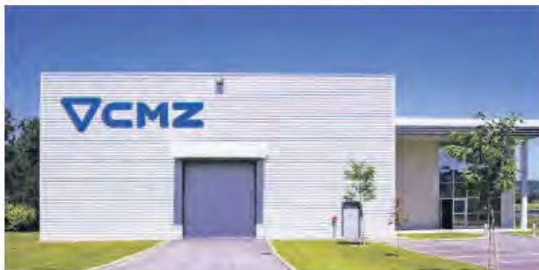
La filial gala abrió sus puertas en 2004 en la localidad de Vaulx Millieu, a medio centenar de kilómetros de Lyon.